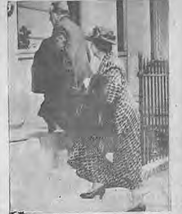
El ex premier inglés, Stanley Baldwin, cuya elevación a Par de la Casa de Lorea, coincidió con su retiro de la vida política, arriba acompañado de su esposa en su casa palacial de la Plaza Eaton, a donde se trasladaron después de largos años de residir en 10 Downing Street, (residencia oficial de los ministros) que se ha reputado como la más incomfortable de Londres.

VALENCIA, 26.—Se informó hoy que Franco continúa concentrando tropas para llevar a cabo un ataque contra Almería, con la cooperación de la flota y de las fuerzas italianas. Anteriormente desembarcó en Málaga una sección de caballería de los regulares de Tetuán. El "Carabanchero" se encuentra a la altura de Málaga; el "Báscara" a la altura de Cádiz y el "Almirante Cervera" está cerca de Santander. Ve Col. 5º.—Pág. CATÓRCE