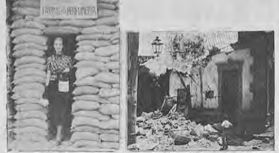
La vida de los negocios no se ha estancado con los bombardeos de Madrid. En el grabado de la derecha, se ve a una linda madrileña saliendo de una farmacia y perfumería que ha seguido despachando sus pedidos en la llamada Avenida de las Bamos, por las muchas que han caído en ella. A la izquierda, una de las calles de Almería muestran los efectos del bombardeo de unidades de la escuadra alemana.